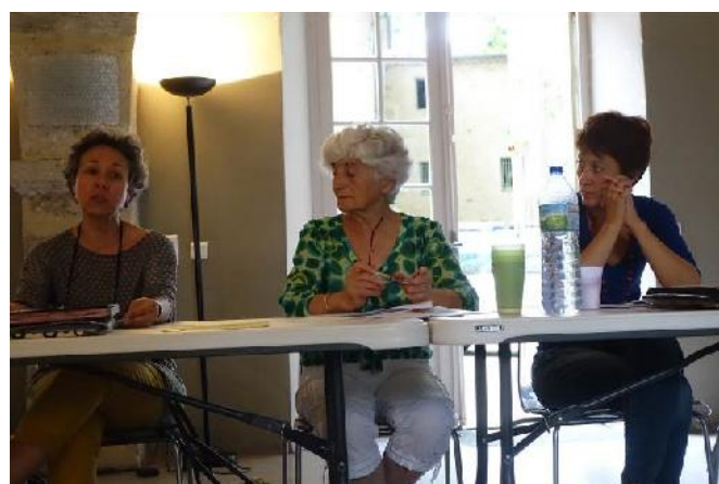
Elus, responsables d'EHPAD, de SSIAD, de CCAS et CIAS, de services d'aide à domicile, d'associations et de clubs de retraités au bilan de la commission réseau