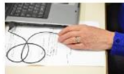
Photo Atelier informatique

Des expériences et témoignages des acteurs locaux, Clubs de 3ème âge et foyers ruraux, EHPAD : des lieux de vie, d'animation et de rencontres