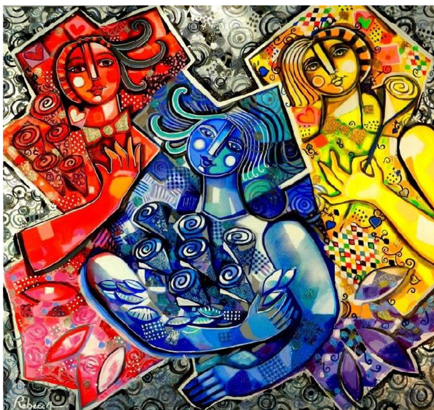
Œuvre © Rebecca de Cachard

Vendredi 23 et Samedi 24 mai 2014 Lézignan-la-Cèbe - Salle Polyvalente